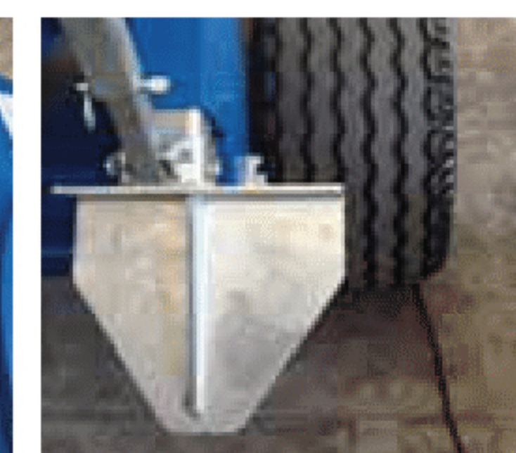
Vanghe posteriori rinforzate Reinforced anchorage rear plate Bêches d'ancrage postérieures renforcées