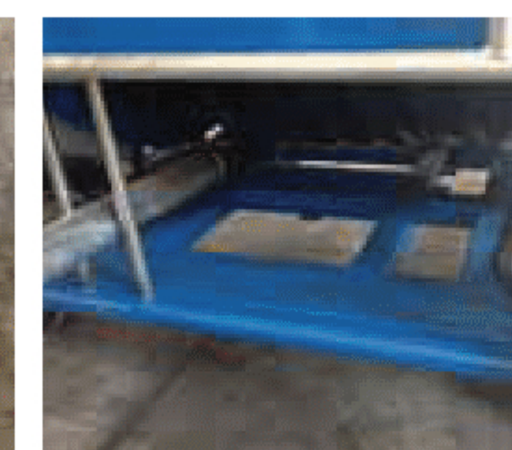
Telaio maggiorato e più robusto Bigger and stronger chassis Châssis majoré et renforcé