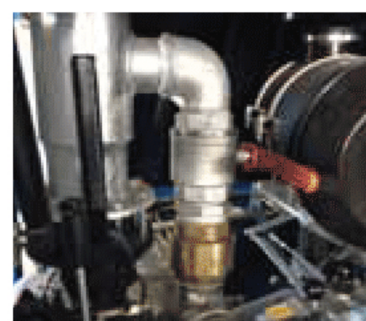
Scarico del compressore Compressor discharge Décharge du compresseur