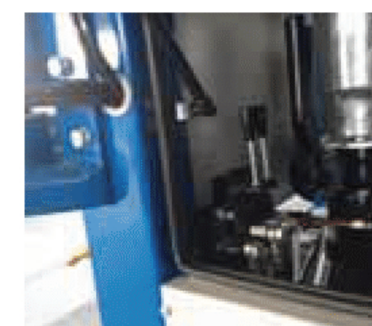
Leva di comando bandiera Control lever for suction arm Levier de contrôle pour le bras porte-tuyau d'aspiration