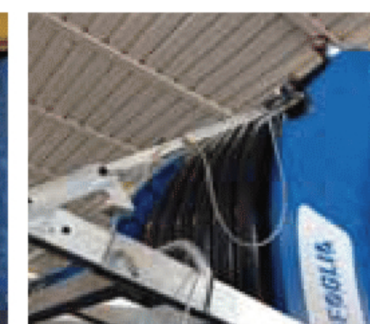
Barra luci pieghevole per omologazione Foldable light-bar for road-type approval Barre-feux pliable pour l'homologation routière