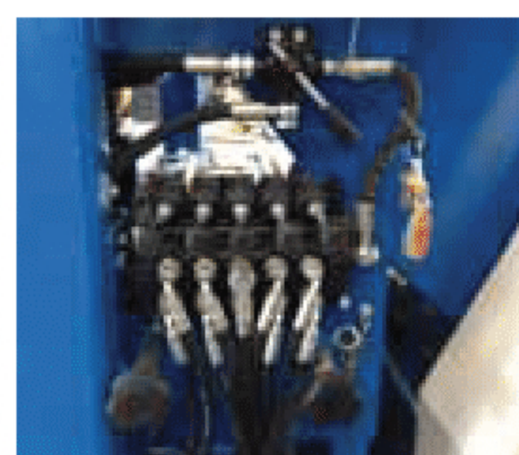
Comandi movimentazione idraulici Hydraulic movements control Contrôle hydraulique des mouvements