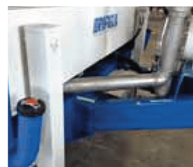
Doppio piedino, doppio rabbocco Double staker leg, double filling point Double béquille, double goulotte de remplissage